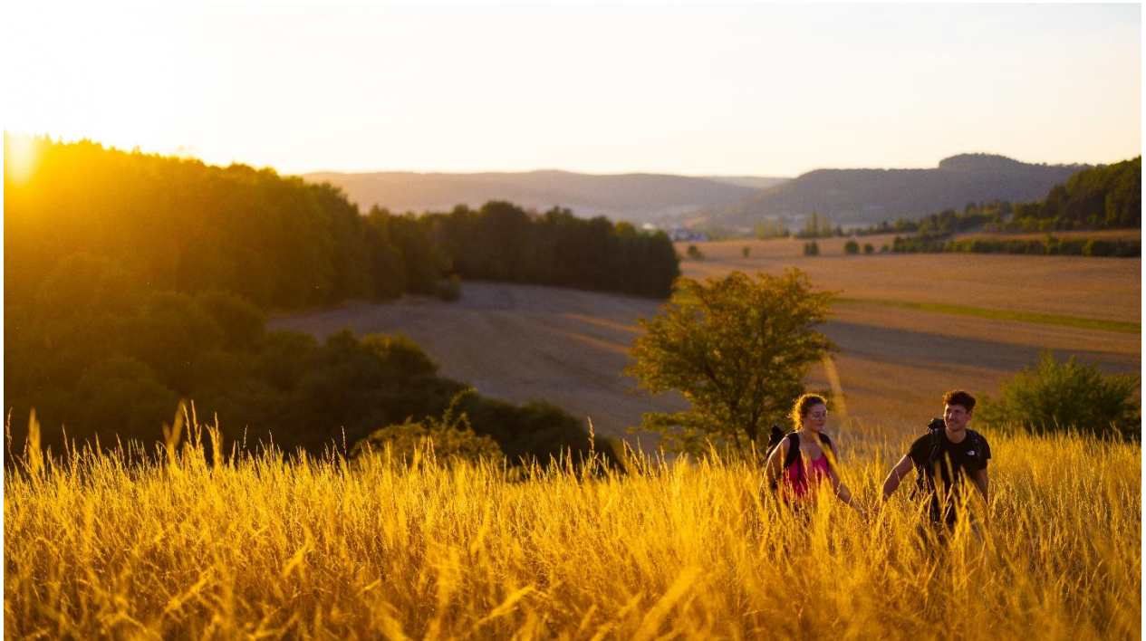
Unterwegs auf dem Goethe-Erlebnisweg

Apolda, 24.05.2024 (tpr) – Idylle mit Tiefgang: Das Weimarer Land, die Region rings um die Goethestadt Weimar, ist ein Eldorado für kulturinteressierte Naturgenießer. Schon Goethe und Schiller fanden hier, abseits der Stadt, Inspiration und Ruhe zum Arbeiten. Der Bauhaus-Künstler Lyonel Feininger liebte es, die Dörfer mit dem Sportrad zu erkunden und zu zeichnen. Zahlreiche weitere große Geister haben den hügeligen Landstrich im Herzen Thüringens geliebt und hier in den Jahrhunderten ihre Spuren hinterlassen – so wie die Region in ihren Werken. Das macht das Unterwegessein hier so besonders.